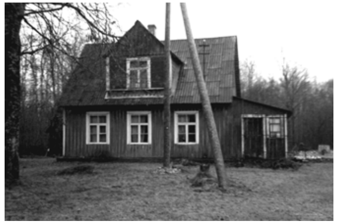
Alfreds hus på Oamusa i Höbring.

området. Det var inte tillåtet att gå ner till stranden och man var alltid tvungen att bära sitt pass med sig. Utan pass vid en kontroll blev man intagen för förhör. En gång när dottern kontrollerades när hon kom hem från skolan visade det sig att hennes pass gått ut och hon fick då betala böter för detta. Under Stalins tid var det hård kontroll men efter hans död luckrades det upp mer och mer.