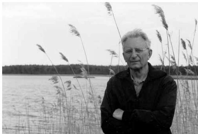
Författaren vid Eestvae år 2000.

Artilleriduellerna från ömse sidor började någon dag senare. Tyskarna släppte upp ballonger till väders för beräkning av vinddrift, och hade rekvirerat spaningsplan som målsökare. Sedan brakade det loss. Ryssarna å sin sida hade utmärkt artilleri och luftvärn med god räckvidd, och var irriterande nära det tyska planet många gånger där rökpuffar avslöjade granatexplosionerna, detta trots att planet befann sig långt