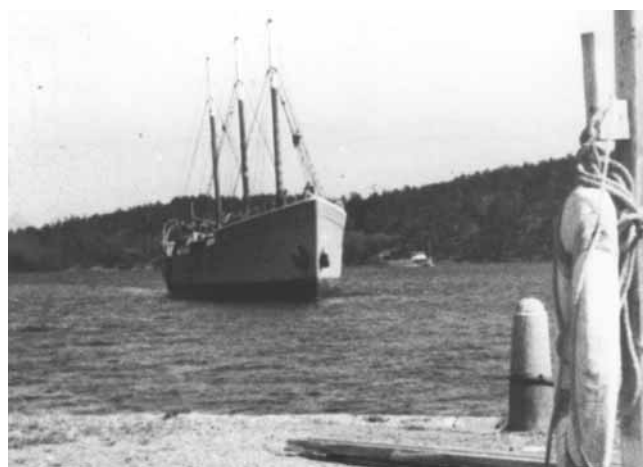
Juhan på infart i farleden till Stockholm

Tisdagen den 15 augusti kl. 12.15 rullade fartyget kraftigt och skonarseglets gaffel bröts itu. Kl. 16.00 hade vi lagat gaffeln och seglet kunde hissas på nytt. Onsdagen den 16 augusti kl. 05.00 bordades fartyget