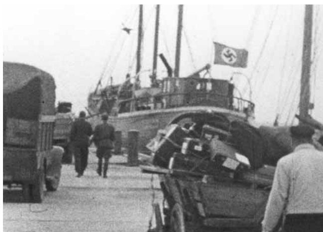
Juhan i okänd hamn

Debarkeringen av de evakuerade började med det samma och avslutades samma kväll. Torsdagen den 13 juli började lossningen av bagaget, vilket slutfördes fredagen den 14 juli. Efter det att lossningen slutförts desinficerades lastrummen av tjänstemän från hamnen. Samma dag avgick vi kl. 16.10 under ledning av lots och sjöpolis med destination Ormsö. När lotsen och sjöpolis hade lämnat fartyget i Sandhamn fortsatte resan till Ormsö, dit vi anlände lördagen den 15 juli och ankrade utanför Förby.